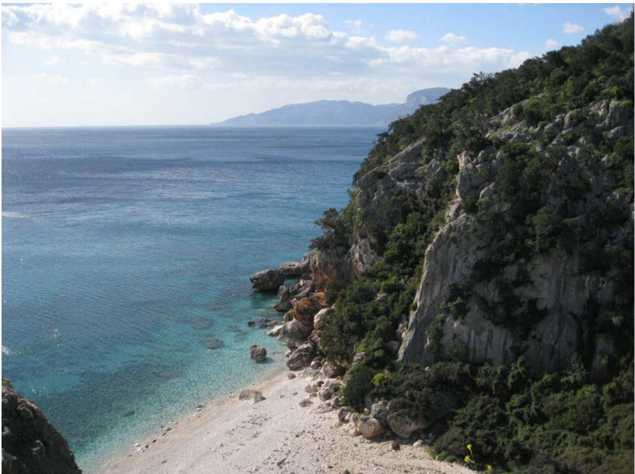
A Cala Fuili ci sono vie adatte ai bambini http://goo.gl/Ln0t1I

In Sardegna le vie di arrampicata sportiva sono attrezzate secondo gli standard di sicurezza. L'attrezzatura è di alta qualità e nelle zone più frequentate è verificata periodicamente. Le vie moderne hanno una chiodatura lunga, mentre quelle alpinistiche non sono attrezzate ed è quindi opportuno dotarsi di martello, chiodi e protezioni. Chi volesse attrezzare una falesia non ha l'obbligo di chiedere autorizzazioni, a patto non riguardi zone con restrizioni di natura ambientalista o si tratti di un monumento naturale. È comunque preferibile farlo adeguandosi allo stile locale ed evitando di incrociare altre vie.