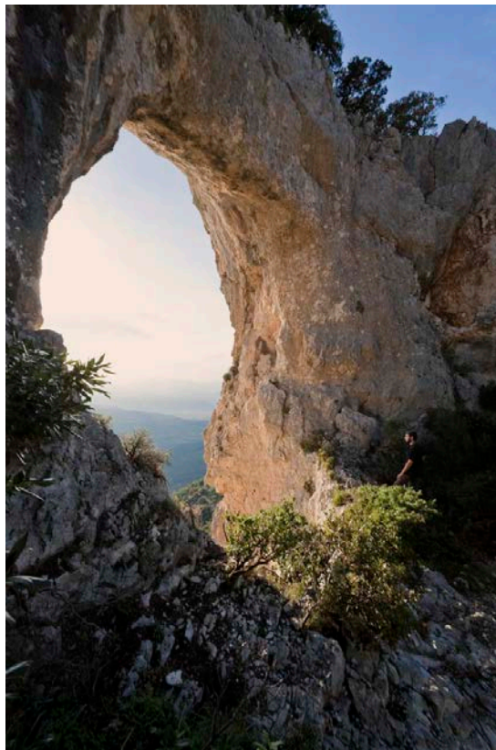
Preta Istampata, una facile via di Galtelli http://goo.gl/deHDLs

Anche le pareti sarde sono ovviamente classificate in base al livello degli scalatori. Ai principianti consigliamo Il Budinetto, La Poltrona e Margheddie a Cala Gonone o Il Villaggio Gallico a Baunei. Seppure meno conosciute, ci sono interessanti vie facili anche a Rocca Doria e a Galtelli (Preta Istampata). A Cala Fuili, vicino a Dorgali, si trovano delle falesie predisposte alla scalata per bambini. Anche in Gallura esistono belle vie facili, in particolare sul Monte Limbara, a Capo Testa e ad Aggius. Per le vie moderne si segnala Surtana, ancora in territorio di Dorgali, mentre la grande classica sarda è lo Spigolo NW della Punta Cusidore. Un arrampicatore di medio livello potrà invece optare per Thailandia e Arcadio a Cala Gonone oppure, verso l'interno, Lanaitto a Oliena. Sul versante occidentale ecco lo stile eterogeneo di Rocca Doria e, più a Nord, la frequentata Osilo. Ai più esperti e allenati infine raccomandiamo Scalette e Raoni o Millennium a Cala Gonone, Braccio di Ferro a Baunei.